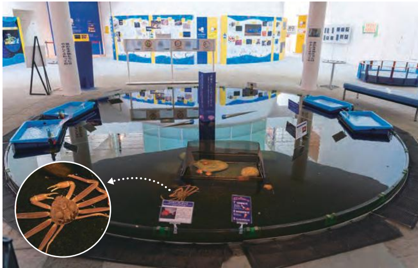
「ほたるいかミュージアム」内にある、深層水に満たされた「深海不思議の泉」には、富山湾に棲む深海魚が展示され、手で触ることができる。入館料620円(3/20～5月下旬のほたるいかの発光ショーの期間は820円)。

60席あるパノラマ レストラン「光彩」 では、富山の恵み を取り入れた和洋 メニューが充実。