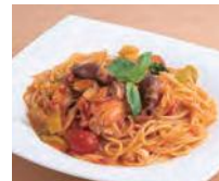
蛸烏賊と紅ずわい蟹のトマ トクリームソースパスタ900 円(税込)。