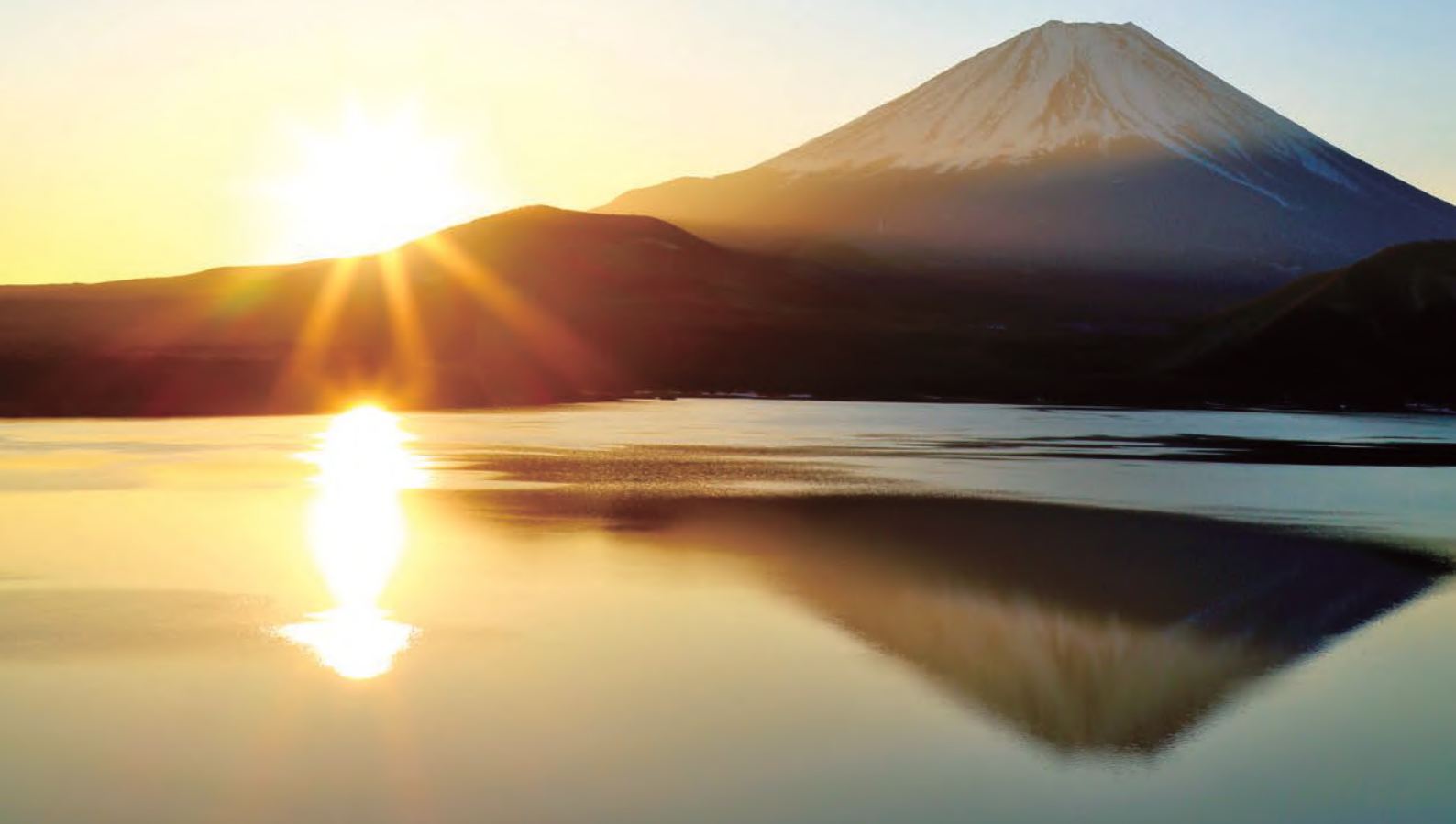
写真: 新年の夜明け 富士山と太陽 (山梨県)