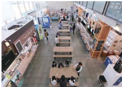
ほたるいかバーガーやフライが名物の「みちcafe wave」と海の幸が豊富に揃うおみやげマーケット。