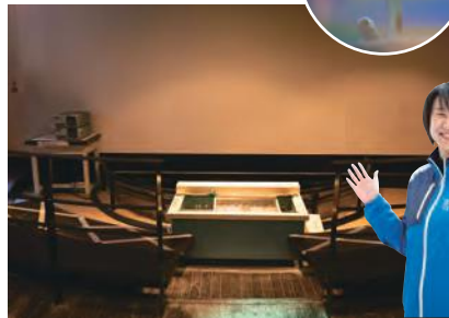
館内ではプランクトンの発光ショーが楽しみ、ダイオウグンクムシやチンアナゴの展示も。