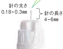
インスリン注射の針(例)