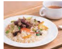
冬限定「蛸烏賊と昆布かま ぼこのピラフ」900円(税込)。