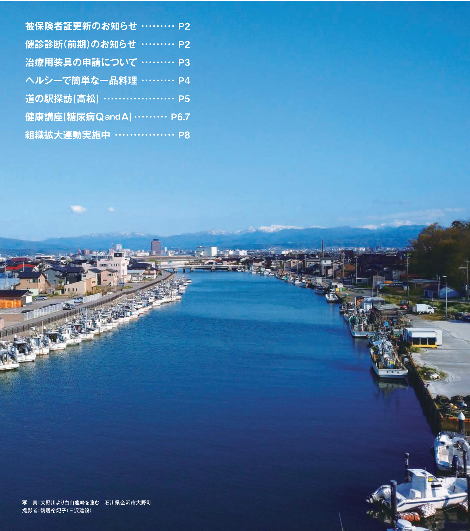
写真:大野川より白山連峰を臨む / 石川県金沢市大野町