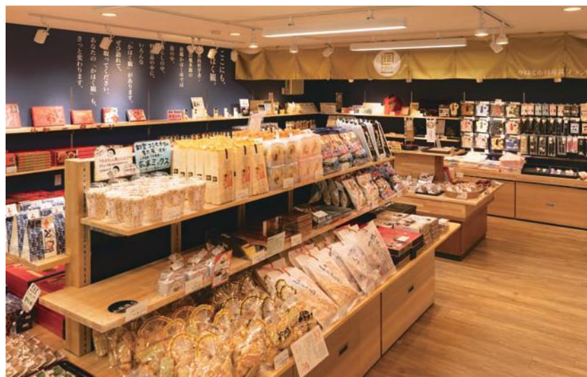
かほく市特産品ブランド認証商品の特設コーナー。繊維製品をはじめ、農産物、お菓子などの加工品など、かほく市の豊かな自然と歴史、人々が育んだ品々が集結している。お土産選びに嬉しい品揃え。