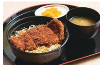
能登豚のソースかつ丼(漬物・みそ汁付き)850円(税込)。友好都市・駒ヶ根市と食の友好も深めたメニュー。発売40日で千杯売れたヒット商品。