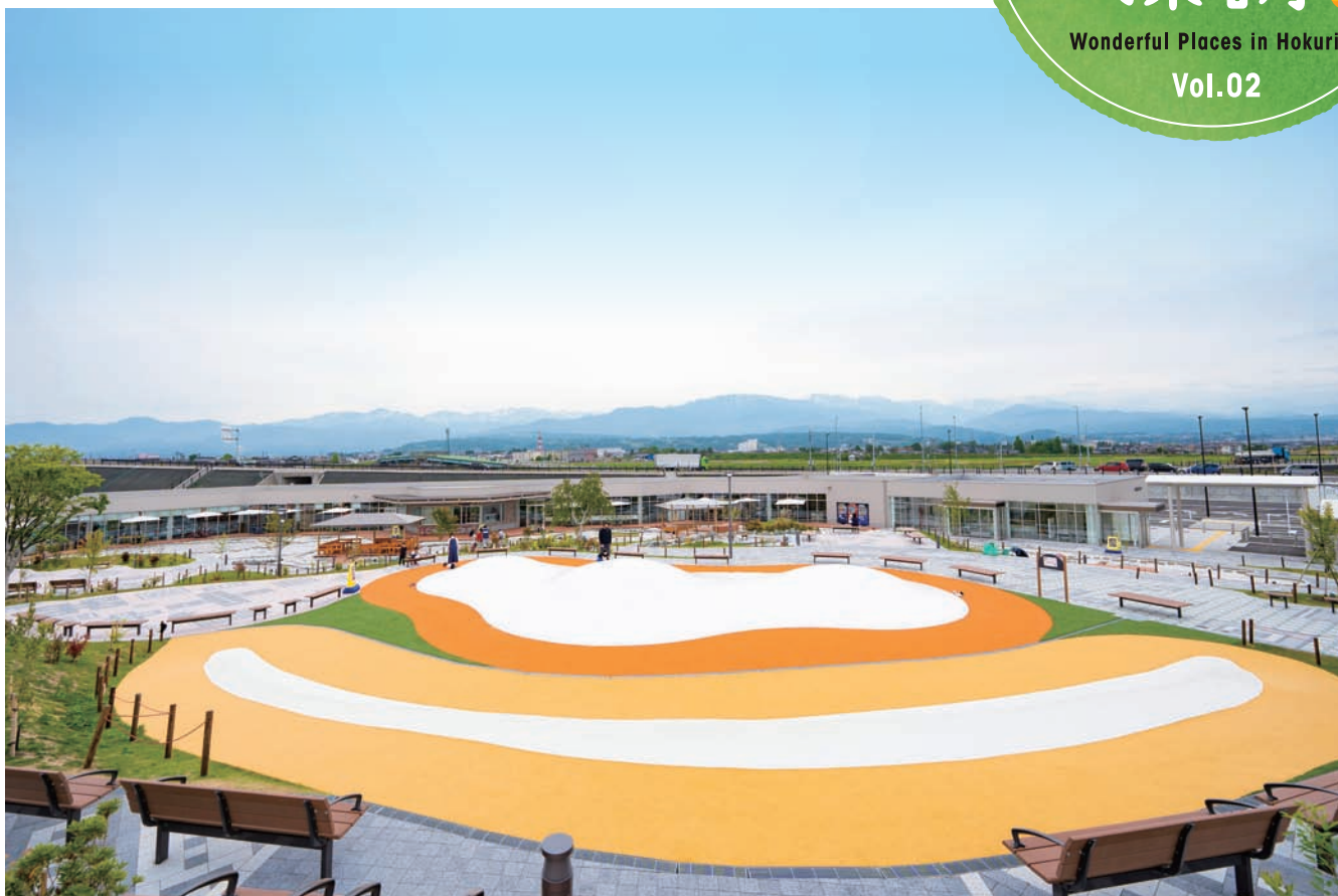
築山の展望台からは北アルプスの山々の景色を堪能できる。斜面を利用した滑り台や、とんだり跳ねたりできるふわふわドームは小さな子どもたちに大人気。