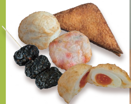
蒲鉾の老舗が営む「練り天屋」のイチオシ「半熟たまごのふわ天」をはじめ、揚げたての練り天は各種1個200円～350円。