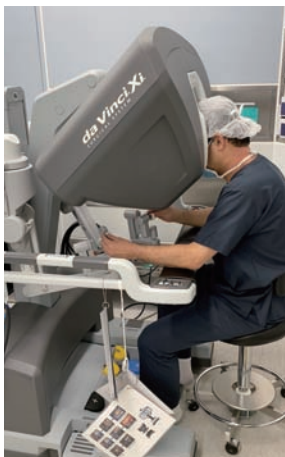
ロボット手術術者