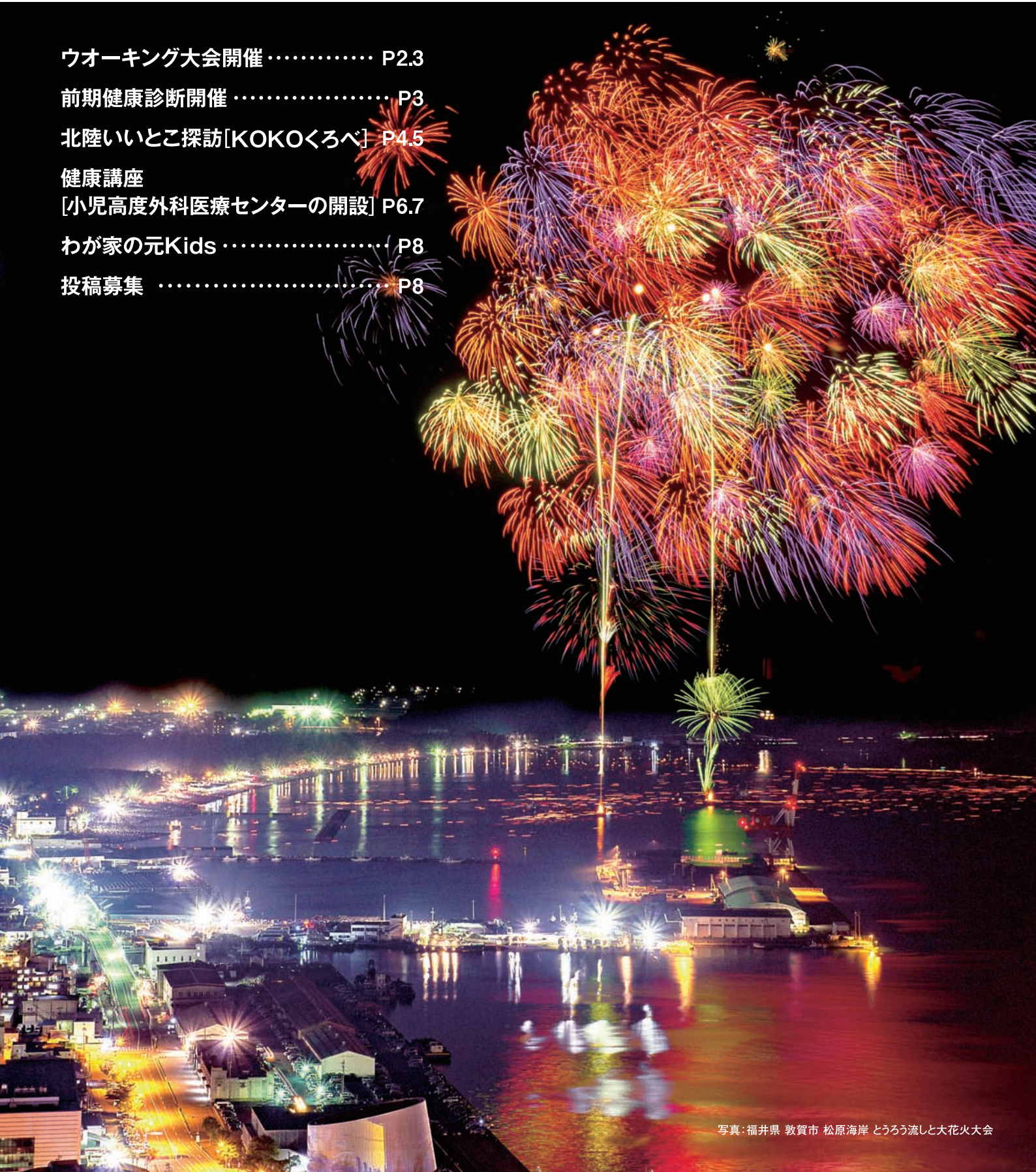
写真:福井県 敦賀市 松原海岸 とうろう流しと大花火大会