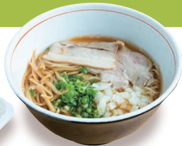
「麺屋はなと」の「貝出汁醤油中華そば」850円。あさりを使ったスープと黒部名水ポークのチャーシューが絶品。