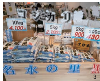
1.定番土産から限定商品など幅広い品揃えの「これらっと」。地ビール「宇奈月ビール」の量り売りも行う。2.3.4.直売所「瑞彩マルシェ」では毎月5日に卵が1パック55円に、22日には黒部名水ポークの加工品を限定販売する。