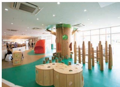
森をイメージした屋内キッズフロア。温もりあふれる木製遊具が設置され、雨の日でも子どもが遊べる。