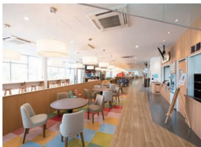
フードコートにはカウンター席やソファ席、小上がり席など、くつろぎながら食事ができるスペースが充実。