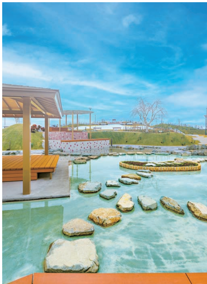
建物に沿って設けられた水辺エリア。飛び石や東屋が配された癒しの空間。