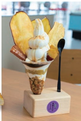
「黒部はるか」の「芋スペシャルパフェ」1,000円。黒部牧場のミルクソフトに地元産さつま芋の濃厚な甘みがマッチ。