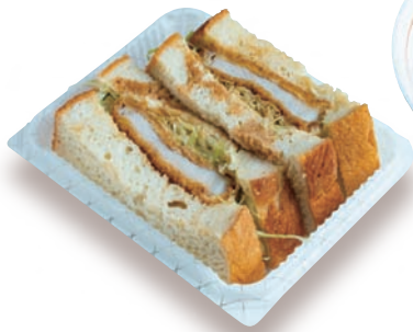
「瑞彩マルシェ」の「名水ポークカツサンド」500円。黒部の米粉を使って焼き上げたパンを使用している。