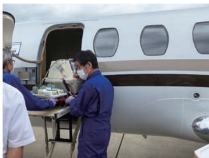
専用ジェット機での乳児搬送

それぞれエキスパートが責任を持って治療を行っています。また小児脳神経外科においては小児脳神経外科認定医を中心に専門性をもった医療が可能となっています。これらの部門が連携をとりながら診療を展開することが高度な外科医療を必要とする子どもたちに適切なタイミングで適切な治療を行うことができます。