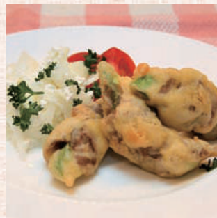
アボカドの肉巻き アーモンドフリット