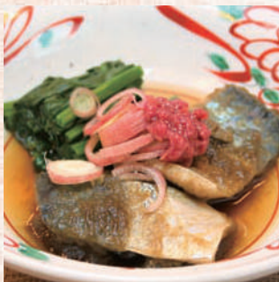
鯖のとろろ昆布煮