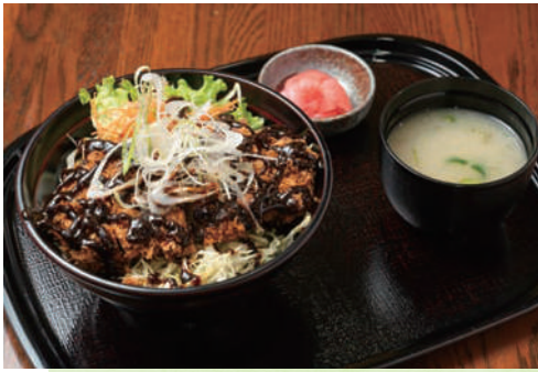
南砺産こしひかり米を使用した「味噌かつ丼」(900円)。自家製味噌ダレが味の決め手。