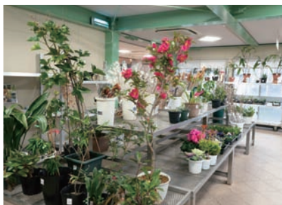
売場には、季節ごとの切り花や山野草、ドライフラワー、花と野菜のタネや球根なども並ぶコーナーも。