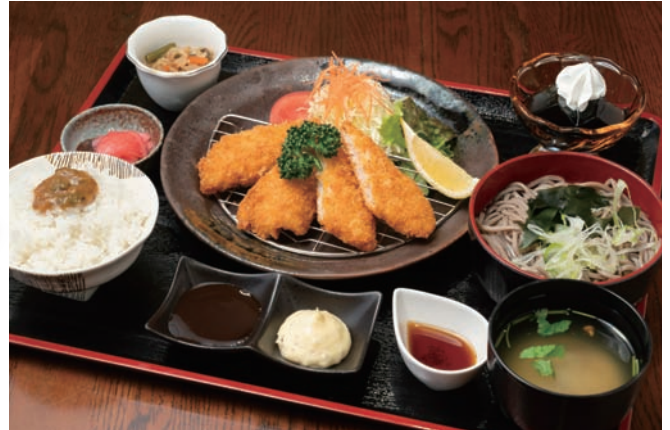
100席を備え、会合などに使える個室もある「レストランたんぼぼ」。イチオシの「日替わり定食」(980円)は、蕎麦やデザートも付く充実の内容。