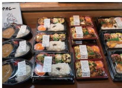
南砺産こしひかりのご飯や豚肉など、地元食材をふんだんに盛り込んだお弁当やお惣菜、おにぎりも好評。