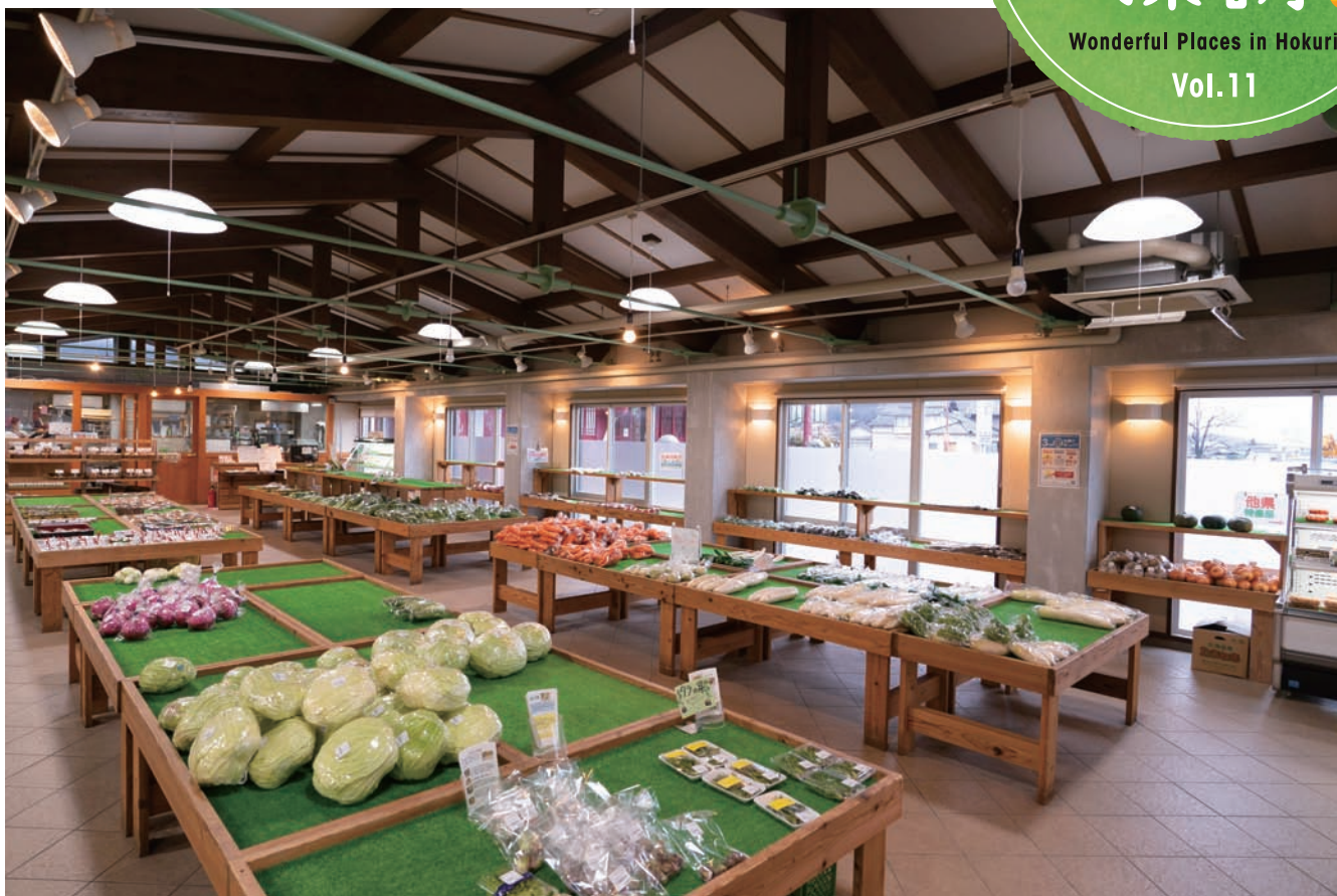
270の生産者が登録する農産物直売所「なんといっぱい市」。春は山菜とアスパラガスが売り切れ必至の人気ぶり。アクセスの良さから金沢からの客も多い。