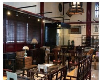
1.特産品・工芸品も豊富に揃える。2.こしひかりの米粉パンは、店内で生地から作られている。3.4.中国・紹興市と日福光町との友好市町締結20周年を記念して建てられた「福光紹興友好物産館」では、中国茶(各種200円)もいただける。